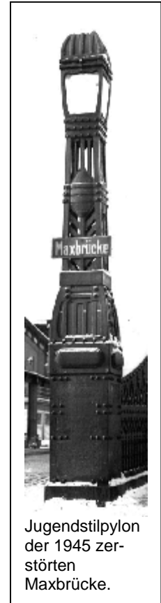
Jugendstilpylon der 1945 zerstörten Maxbrücke.