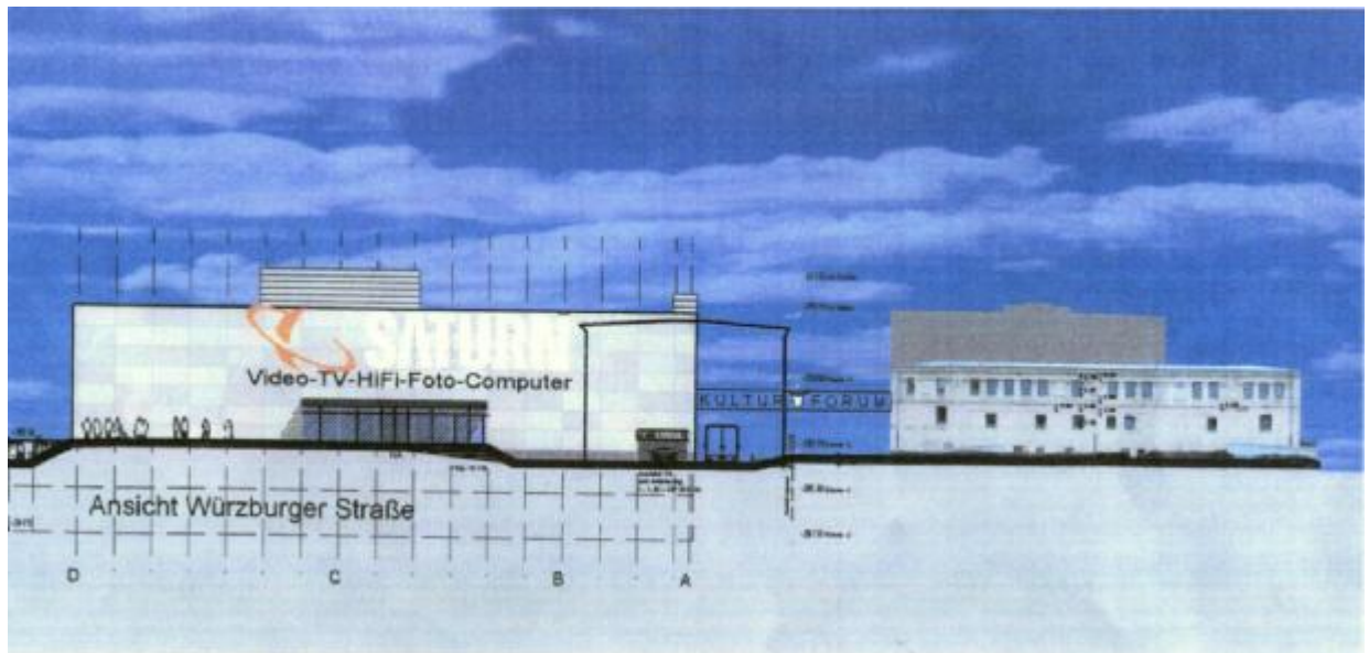
Fassadenvariante 1, Ansicht von der Würzburger Straße. Rechts das Kulturforum, in der Mitte die Silhouette der ehemaligen Evenord-Bank. Der Baukörper soll noch etwas abgesenkt werden.

Bei der zweite Variante von Saturn Media laufen über die Fassade auf Höhe der Fensterfronten des angrenzenden Polizeipräsidiums drei Gesimslinien, die einen binären Code darstellen, dem Grundprinzip digitaler Elektronik. Ich finde die Idee recht originell, leider ist sie vielen für Fürth nicht bieder genug. Abgesehen davon hat Saturn diese Variante bisher nur mit einer einfarbigen Fassade vorgestellt, nicht mit in der Farbe leicht variierenden Feldern wie oben. Eine einfarbige Fassade würde aber das immense Bauvolumen sicherlich noch stärker betonen, wovon naturgemäß abzuraten ist.